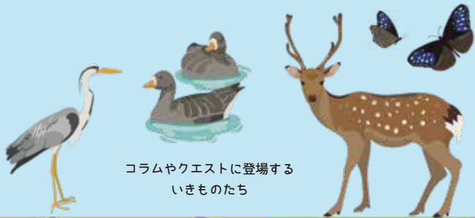
コラムやクエストに登場する いきものたち